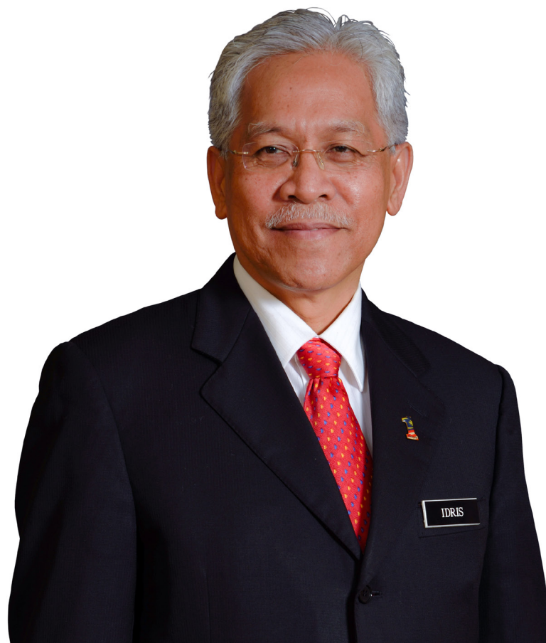
YBhg. Dato' Seri Idris Jusoh Menteri Pendidikan Tinggi